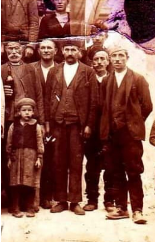
Сл. 1. Особа са кованицама, прва с десна (део фотографије послератне генерације Ђака са родитељима 1947/8. године, Основна школа, село Вакуп, Алексинац).

Разликовали од тзв. „свињских опанака“ који су се лако цепали по газишту. Разлог популарности кованица је практична неподеривост и израда без икаквих трошкова. У зависности од умећа, разликовали су се у детаљима... Посебно је падао у очи повијени предњи део газишта, у складу са кривином саме гуме.